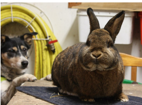
Vilma spanar på en Wiener, viltgrå 11 | KANIN STHLM | NR 4 2013

När kaninerna kom upp på bordet för en sista koll inför utställningen dagen efter stod Vilma troget vid bordet och tittade nyfiket på vad vi gjorde.