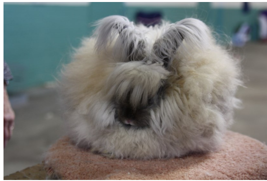
Engelsk angora, madagaskar