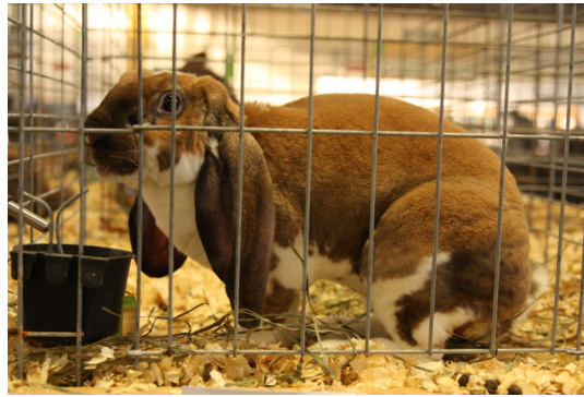
Engelsk vädur, rex manteltecknad madagaskar