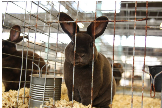
Liten rex, havana