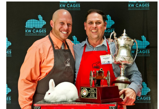
Best in show, Florida white med sin ägare och BIS-domaren

ARBA convention håller på i 6 dagar i sträck och på måndagen höll man BIS uttagningen för seniorer och juniorer. BIS för seniorerna blev i år en Florida White och BIS för juniorerna blev en Holländsk kanin. Att kunna säga att min kanin var bäst av 22.000 kaniner måste vara en häftig känsla och en känsla väldigt få personer får uppleva. Dock finns det några i USA som lyckats med denna bedriften mer än en gång.