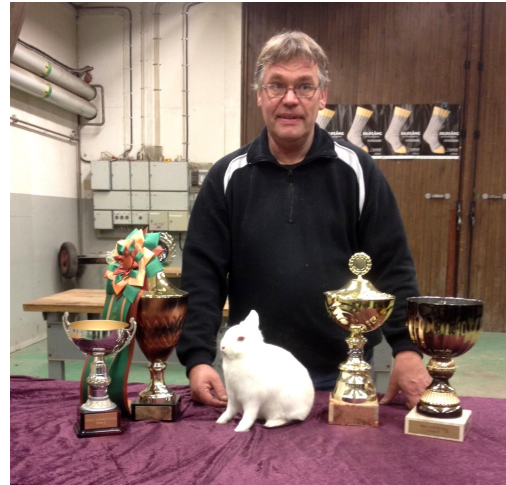
Best in show, Hermelin vit rödögd 96p