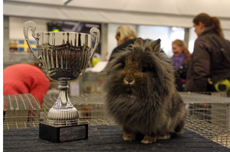
Förgätmigejs Royal Gala, 95px2

' * "Domestic Rabbits & Their Histories – Breeds of the World" av Bob D. Whitman