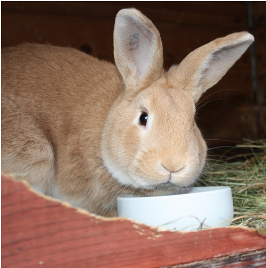
En av Birgittas kaniner av rasen Orange