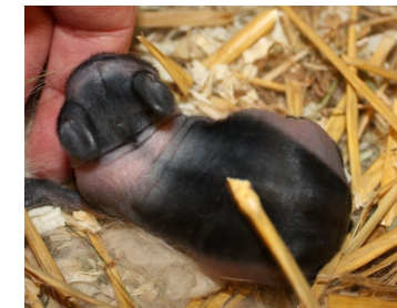
En ca. 3 dagar gammal unge

som undrar vad de har fått för sjukdom eller defekt på sina små kaninungar.