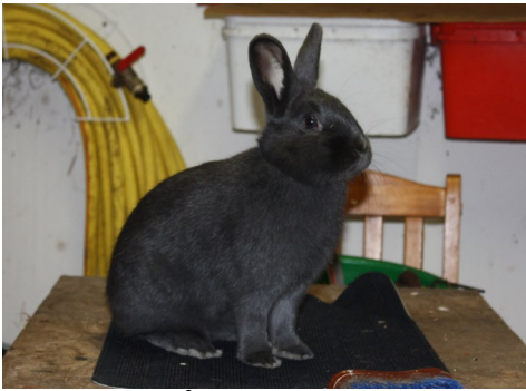
Lilla wiener, blå