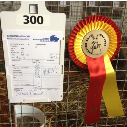
13 | KANIN STHLM | NR 4 2013

Klockan började närma sig söndag eftermiddag när jag svängde ut från Jordbrons lilla Lantgård i Upphärad och styrde hemåt igen mycket nöjd efter en helg med bra poäng på mina kaniner (95p och 94,5p x 2), en trevlig kaninställning, jag varmt kan rekommendera, och många trevliga gårdsbesök.