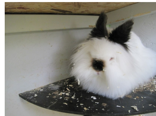
En Lejonhuvad kanin, rysstecknad