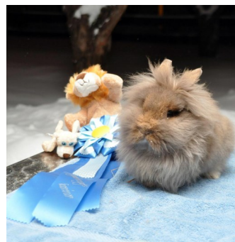
Bästa juniorägda lejonhuvad kanin