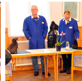
Uttagning av klubbmästare, senior